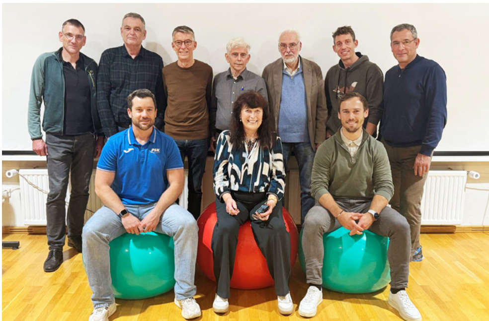
Aufsichtsrat und Geschäftsführung

kündigungsrecht zum 31. Dezember 2025 wurde eingeräumt.