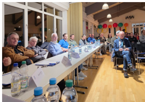
Aufsichtsrat und Protokollant

Wichtige Beschlüsse der Versammlung betrafen die Satzungsänderungen zur Beitragsordnung. Zukünftig werden die Regelungen zum Mitgliedsbeitrag nicht mehr direkt in der Satzung, sondern in der Beitragsordnung festgehalten, und der Beitragseinzug erfolgt quartalsweise. Mitglieder werden umfassend über die Änderungen informiert, ein Sonder-