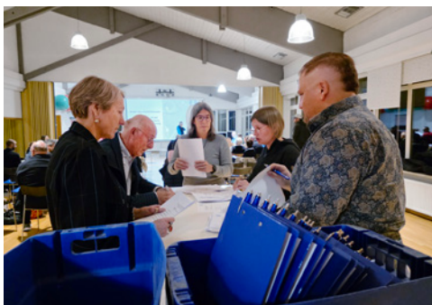
Unterstützung durch die Wahlhelfer der Aufsichtsratswahl

Die Delegiertenversammlung endete mit Dankesworten an alle Ehrenamtlichen, die den Verein mit Engagement und Herzblut tragen. Mit klaren Strukturen, erfolgreichen Projekten und positiven Perspektiven startet der PSK motiviert in das kommende Jahr.