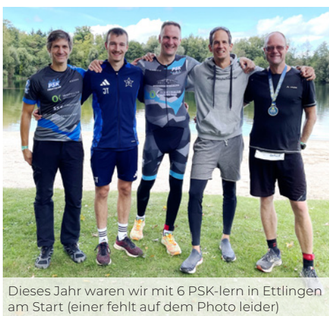
Dieses Jahr waren wir mit 6 PSK-lern in Ettlingen am Start (einer fehlt auf dem Photo leider)